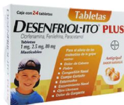
7502276040405 DESENFRIOL-ITO PLUS MASTICABLE C/24 TAB BAYER