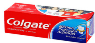
7509546039152 PASTA COLGATE MFP 22 ML COLGATE