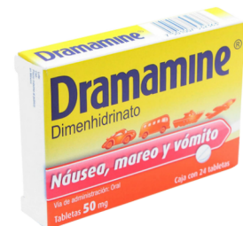
7501007532363 DRAMAMINE C/24 TAB JANSSEN CILAG