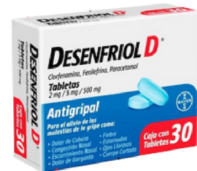
7502276040368 DESENFRIOL D C/30 TAB BAYER