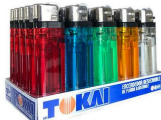
17501086106896 ENCENDEDOR TOKAI TRANSP COLOR C/25 PZ TOKAI