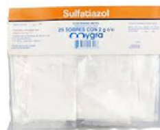
734722456417 SULFATIAZOL MYGRA 2G 25 SB PVO MYGRA