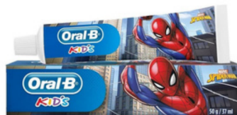
7500435145152 ORAL B SPIDER 50 ML PGAMBL INC