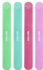
8412122051303 LIMA DE UÑAS STEP 2