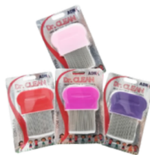
7500462933791 DR CLEAN PEINE ANTI PIOJOS C/1 PIEZA ADN