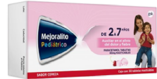
7451079003523 MEJORALITO PEDIATRICO C/30 TABLETA GLAXOSMITHKLINE