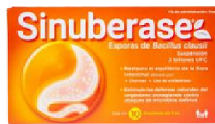
7501159580182 SINUBERASE ORAL 10X5ML AMP SANOFI