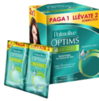
7509546015699 SH. PALMOLIVE OPTIMS 10 ML EXH. C/48 PIEZAS COLGATE PALMOLIVE