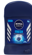
42355472 DESODORANTE NIVEA FRESH ICE STICK 50G