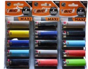
070330617278 ENCENDEDOR BIC MAXI PAQ C/15 PIEZAS BIC