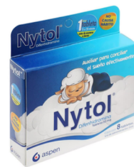
7502253073211 NYTOL 50 MG 8 TAB ASPEN LABS