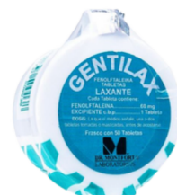
7501737500038 GENTILAX Pastillero c/50 TABS. 60 MG. HENKEL