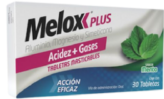
7501165002920 MELOX PLUS MENTA C/30 TABLETAS J&J