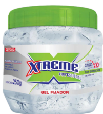
7503002163023 GEL XTREME 250 GR TRANSPARENTE HENKEL