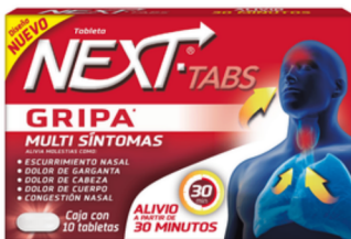
650240010538 NEXT C/10 TABLETAS GENOMMA