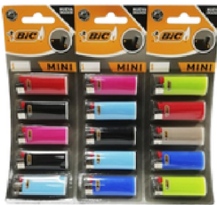
070330617285 ENCENDEDOR BIC MINI PAQ C/15 PIEZAS BIC