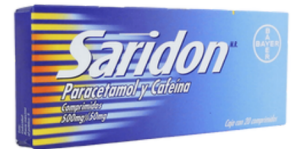
7501008409541 SARIDON C/20 TABLETAS BAYER