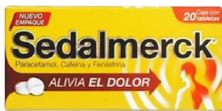
7501298281209 SEDALMERCK C/20 TABLETAS