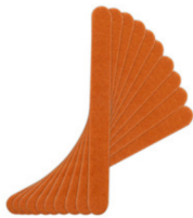
7501370240506 LIMAS DE MADERA CHICA BOLSA C/10PZAS.