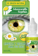
736085278507 MANZANILLA SOPHIA ORIGINAL 15 ML LABORATORIO SHOPIA