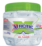
7501199416861 GEL X-TREME TRANSP VIAJE 100G HENKEL