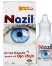
736085132069 NAZIL OFTENO GTS 15 ML LAB SOPHIA