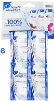
7590002008898 SH. H&S LIMPIEZA RENOVADORA 10 ML EXH. C/24 PZ PROCTER & GAMBLE