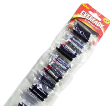
8999002604755 EVEREADY PILA AAA TIRA C/20 PARES EVEREADY