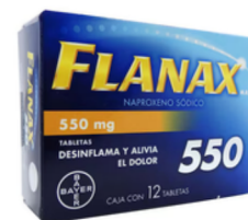
7501008497340 FLANAX 550 MG C/12 TABLETAS BAYER