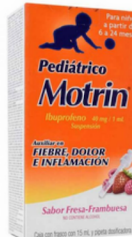
7501109902866 MOTRIN INF FSA-FRAM SOL 120ML J&J