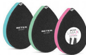
8412122081379 LIMAX LIMA PARA DUREZAS 6 EN 1