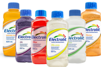
Preguntar por los sabores ELECTROLIT SOL C/625 ML COCO, FRESA, LIMA LIMON, MANZANA Y UVA.