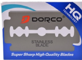
8801038200026 NAVAJA DORCO C/10 PAQUETES DORCO