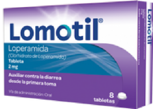
7501057002663 LOMOTIL C/8 TABLETAS JANSSEN CILAG