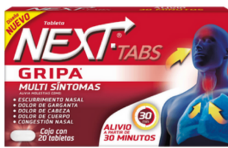
650240031700 NEXT C/20 TABLETAS GENOMMA