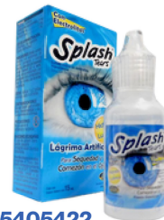
736085405422 SPLASH TEARS 15 ML SOPHIA