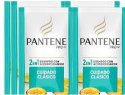
7506295326564 SH.PANTENE 2EN1 CUIDADO CLASICO 10 ML C/24 PZ PROCTER & GAMBLE