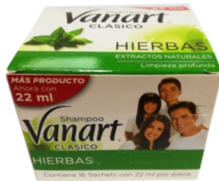
650240033568 SH. VANART HIERBAS 22 ML EXH C/16 PIEZAS GENOMMA