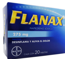
7501008497357 FLANAX 275 MG C/20 TABLETAS BAYER