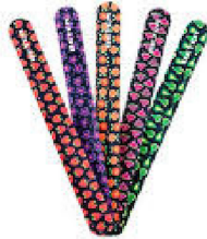
8412122051228 LIMA DE UÑAS COLOR FRUTAL