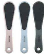
8412122081553 LIMA PEDICURA ERGONOMICA